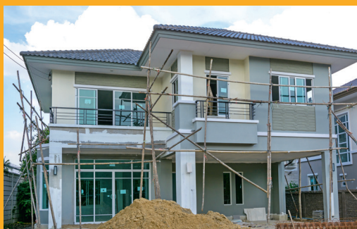
HABITATS INDIVIDUELS ET COLLECTIFS