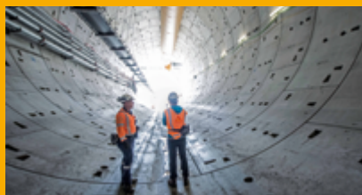
TUNNELS ET TRAVAUX SOUTERRAINS