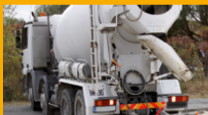
BÉTON PRÊT À L'EMPLOI