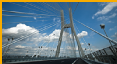
BÉTON D'INFRASTRUCTURE ET OUVRAGES D'ART

ACTIVITÉ BPE PRÉFA GRANDS CHANTIERS 84, rue Édouard Vaillant 93350 Le Bourget bpe@fr.sika.com