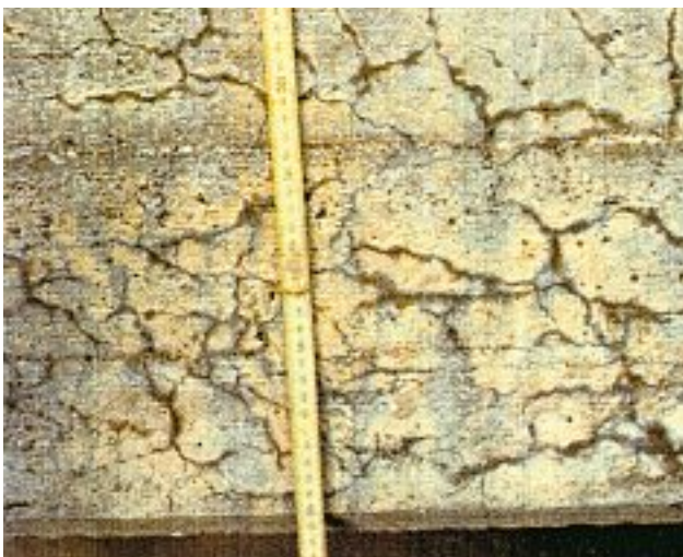
Photo 2 : Vue rapprochée de fissures typiques dues à l'alcali réaction

Les Ponts et Chaussées établirent aussi un groupe de travail qui avait pour objectif de proposer des options de rénovation sur quelques structures qui montraient de nombreuses fissures, et donc de suggérer des pistes d'améliorations sur la protection des ponts en béton en général.