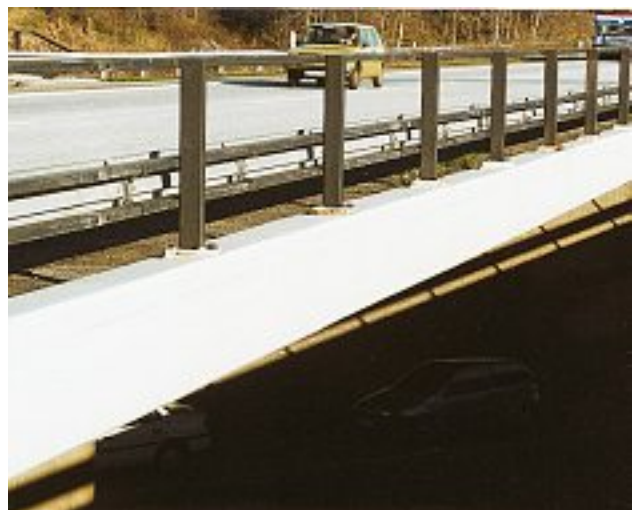
Photo 3 : Parapet après réparation et protection avec l'Icosit Elastic

Les deux ponts restants ont été laissés non protégés afin d'être suivi et de servir de référence pour prouver l'efficacité des traitements.