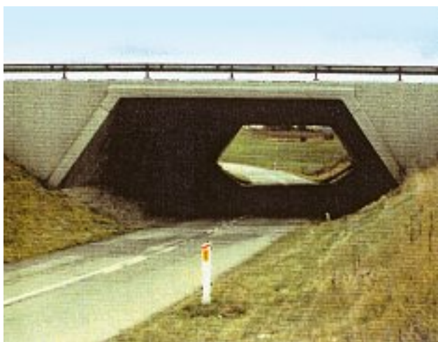
Photo 4 : Un des ponts réparés de l'autoroute M60/M61 durant l'évaluation de 1994

Les bétons ont été sous surveillance et suivis sur les 5 dernières années jusqu'en 1988 incluant des mesures fréquentes d'épaisseur de fissures, de mouvement et des mesures d'humidité du béton.