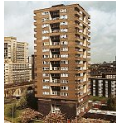
Photo 8 : Immeuble Albert Barnes à la fin des travaux de rénovation en 1983

Dans le cadre de l'évaluation, 4 échantillons de béton furent prélevés (carottes d'environ 100 mm de diamètre et 100 mm de long) et mis sous film plastique en vue d'être envoyés au laboratoire Taywood Engineering pour analyse.