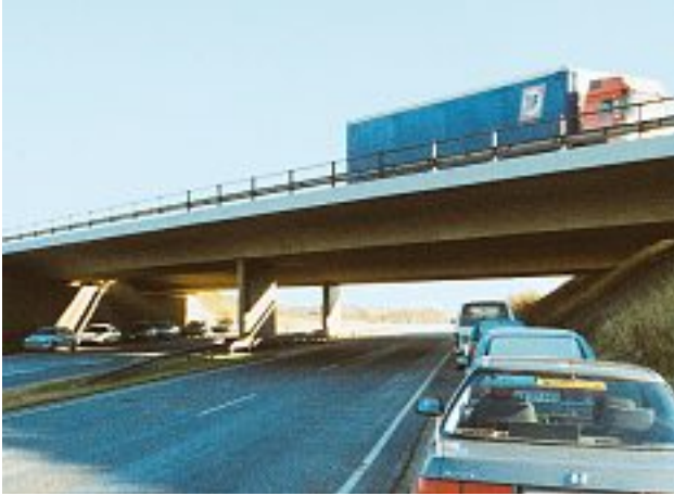
Photo 1 : Un des ponts sélectionnés sur l'autoroute M60/M61 (1997)

En ligne avec les problèmes de durabilité rencontrés sur les ponts en béton construits dans les années 60, les Ponts et Chaussées Danois organisèrent une étude d'inspection et de recherche des origines des causes de la détérioration des bétons.