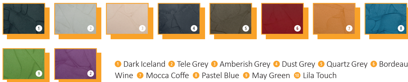
1 Dark Iceland 2 Tele Grey 3 Amberish Grey 4 Dust Grey 5 Quartz Grey 6 Bordeaux Wine 7 Mocca Coffe 8 Pastel Blue 9 May Green 10 Lila Touch