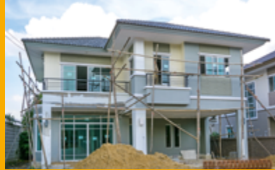
HABITATS INDIVIDUEL ET COLLECTIF