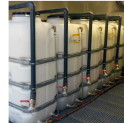
Cuves à simple ou double parois de 800 à 5 000 l pour stockage des adjuvants sur chantier