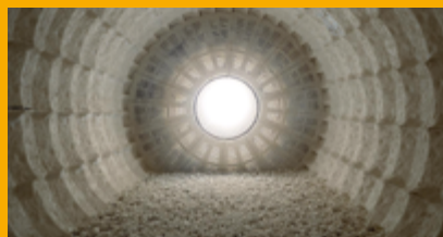
INDUSTRIE DU CIMENT