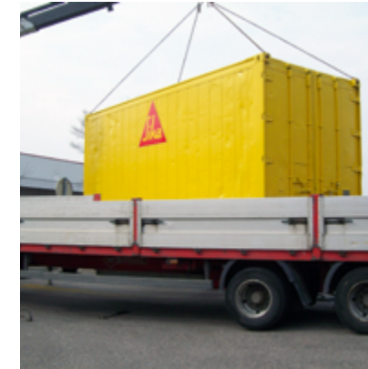
Conteneur équipé pour stockage et dosage des adjuvants

Hydrofuge de masse pour mortiers et bétons.