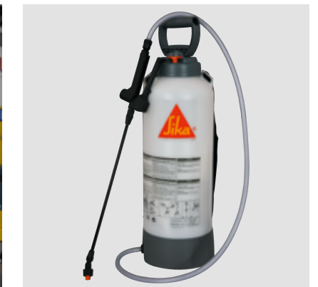
Pulvérisateur 8 l pour huile de décoffrage et produit de cure