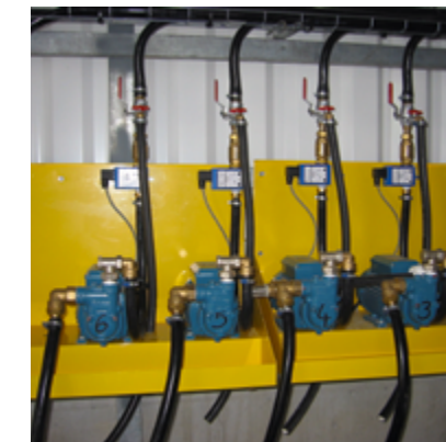
Pompes doseuses à adjuvants Comptage par débitmètre électromécanique ou volucompteur