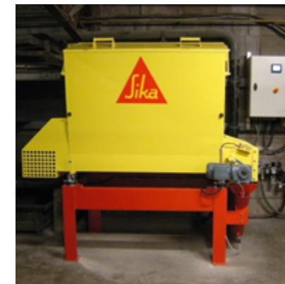
Doseur Sika Fiber Dispenser pour fibres polypropylène ou macrosynthétiques