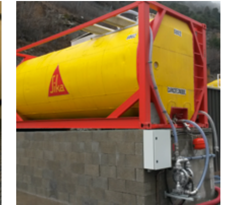
Cuve pour adjuvant (cuve thermostatée pour maintien en température du Sigunit, pour une meilleure performance lors de la projection)