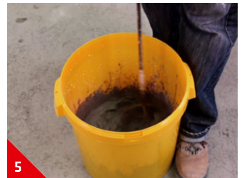
5 Mélanger 3 min à l'hélice 4 branches