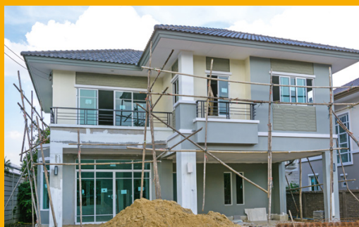
HABITATS INDIVIDUEL ET COLLECTIF