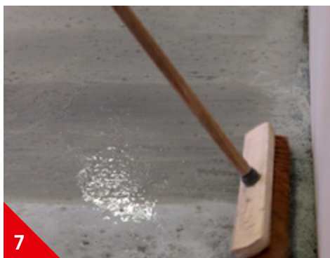
7 Étaler au balai de cantonnier