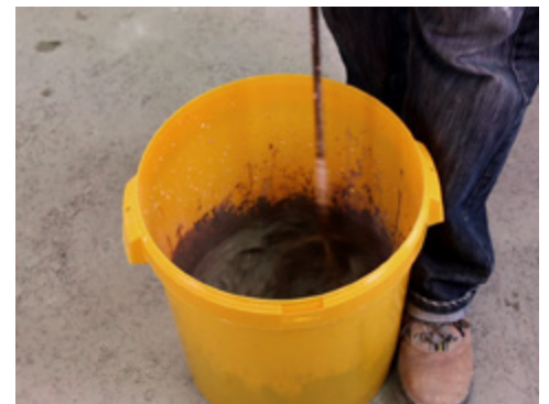
Mélanger 3 min à l'hélice 4 branches