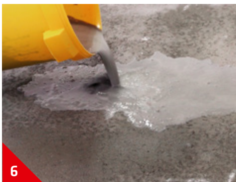
6 Verser sur le support propre et sec