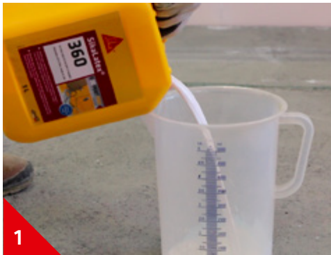
1 Verser 1 volume de SikaLatex®-360 (ex. 0,5 l)