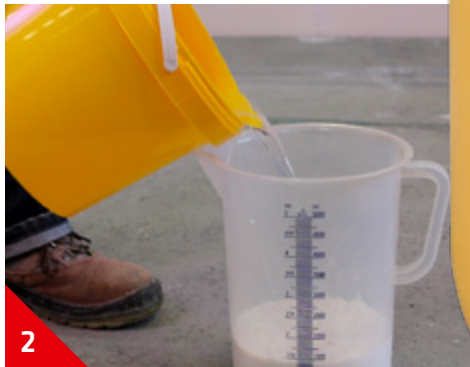
2 Ajouter 2 volumes d'eau (ex: 1 l)