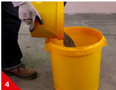
4 Ajouter 3 volumes de ciment (ex: 1,5 l)