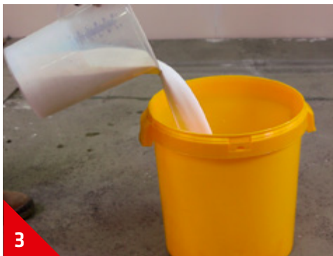
3 Verser la solution dans un seau vide